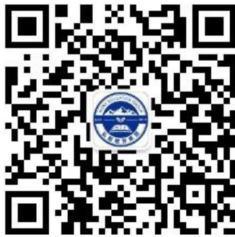
迁安市弘毅学校公众号二维码